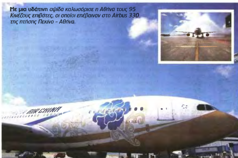
Με μια υδάτινη αψίδα καλωσόρισε η Αθήνα τους 95 Κινέζους επιβάτες, οι οποίοι επέβαιναν στο Airbus 330 της πτήσης Πεκίνο - Αθήνα.

Ο κ. Κουβέλης ευχαρίστησε ιδιαίτερα τις κινεζικές αρχές, καθώς και την Air China, ενώ εξέ-