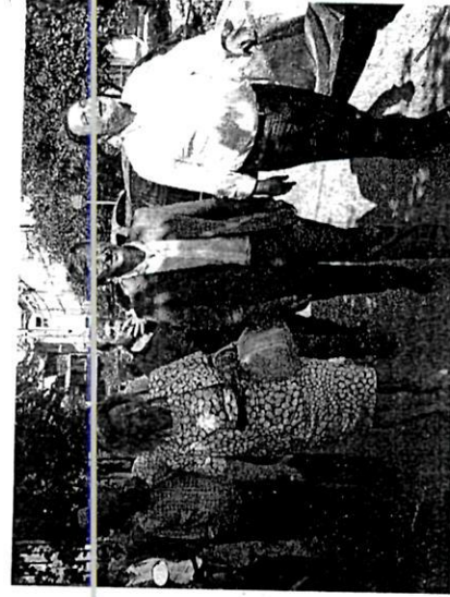
Το Εφετείο Ανατολικής Κρήτης