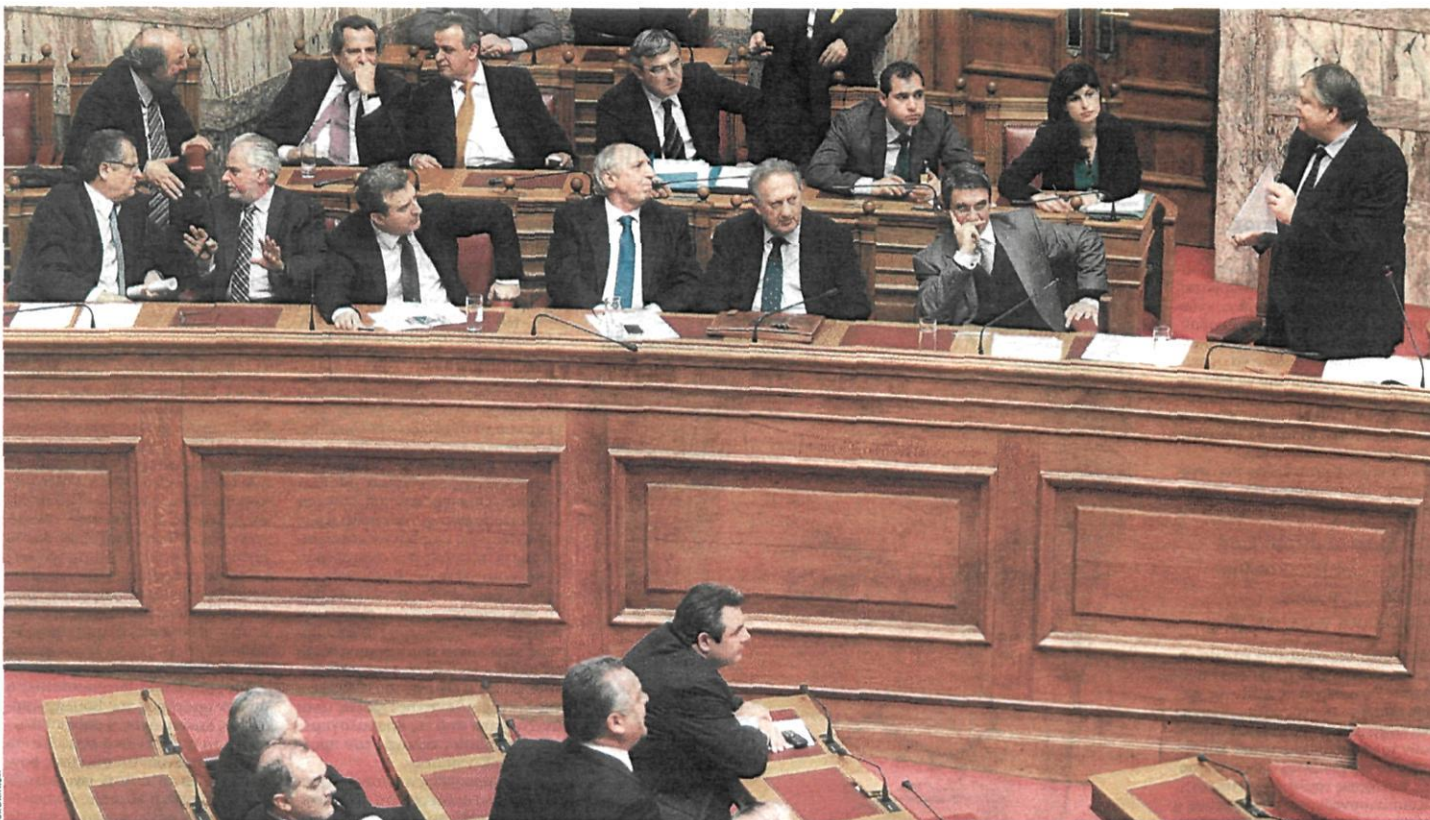
Σύγκληση και προβληματισμός στα κυβερνητικά έδρανα το βράδυ της Τρίτης στη Βουλή. Προβληματισμένοι είναι και ο Πρωθυπουργός, που σκέπτεται πλέον σοβαρά τον ανασχηματισμό